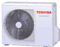
Zunanja naprava (simbolična slika)

→ A+++ za hlajenje in ogrevanje Ozonski čistilnik zraka in filter Ultra Pure Serijsko vgrajen modul za povezavo Wi-Fi