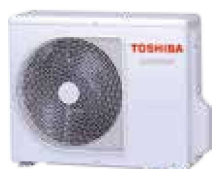
Zunanja naprava (simbolična slika)

→ Največja učinkovitost A+++ Quiet Mode in Super ionizator Plazma filter