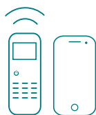
Udoben daljinski upravljalnik z osvetljenim zaslonom in nastavljivim tedenskim časovnim programatorjem

* modul za povezavo Wi-Fi je na voljo kot dodatna oprema z možnostjo integracije v napravo